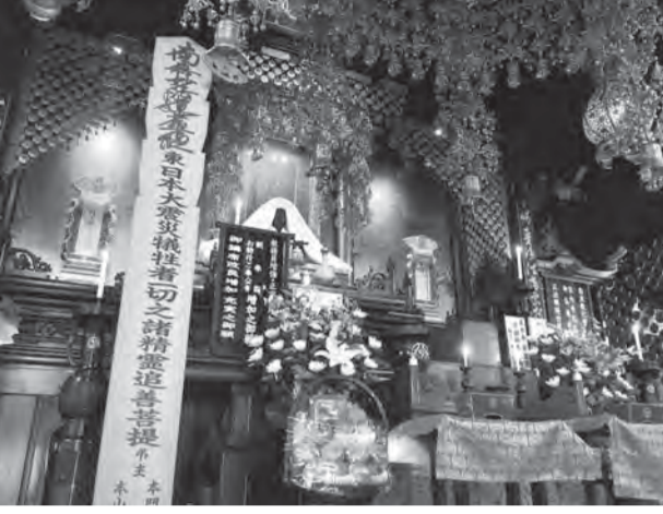
本山の内陣に祭壇を荘厳し大塔婆を建立して大震災4年目のご回向を厳修した